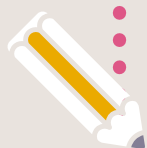
IMMAGINE COORDINATA IL TUO HOTEL È UNICO